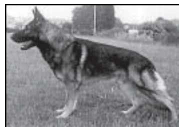
Torro vom Körbelbach