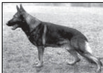
Arek vom Stoffelblick