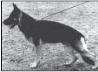
Troll vom Körbelbach