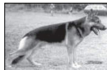
Asko vom Joufne Keyleff

Дези Глеенбахталь (Desi vom Gleenbachtal), точно такой же, как Ани Вахтерсфлур (см статью о питомнике «бёзен Нахбаршафт»). Ракер, ее отец, был сыном Нины Ильцталь, поэтому Дуня имела