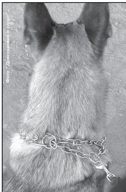
Фото "Дрессировка и спорт"