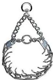
Ошейник с застёжкой

Большинство строгих ошейников подгоняются и расстегиваются с помощью сжатия любого из звеньев ошейника. Но также существуют ошейники, на которых предусмотрен специальный разъемный механизм, чаще всего он расположен на цепочке, но может быть реализован и другим способом. Работает такой строгий ошейник точно так же, как и обычный, но он гораздо удобнее