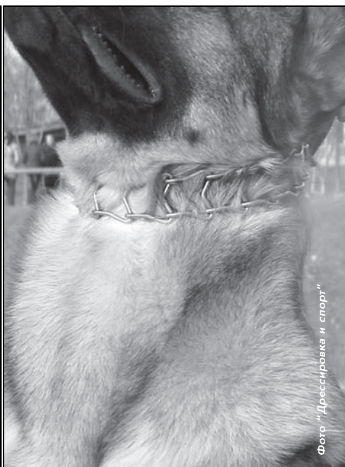
Фото "Дрессировка и спорт"